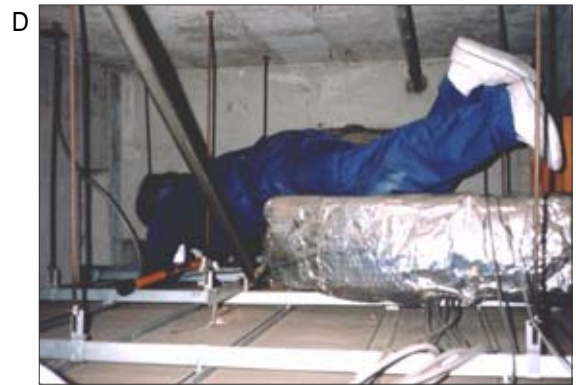
D 電気工による天井内で横に這いながらの作業で、写真の下に部屋があります。電気工、水道工、ダクト工、衛生設備工は天井内作業があり、写真はありますが天井に石綿吹きつけがある場合、壁をこすって、石綿にばく露することがあります。