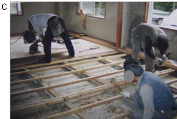
C 大工工。床材(畳やフローリング等)の下地(=根太(ねだ)といいます。)をつくっているところ。大工の棟梁は住宅建築では最初から竣工まで取り仕切りますので、様々な状況で建材に含有している石綿に接する機会があります。