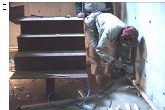
E 大工が、エアの釘打ちでボードを留めています。エア作業は、床に堆積している石綿粉じんを再飛散させます。