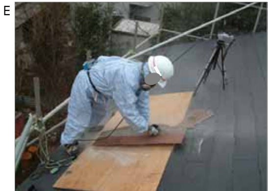
屋根工が、屋根用の石綿含有化粧板を切断する作業を行っています。多くの屋根材に、石綿が使用されていました。