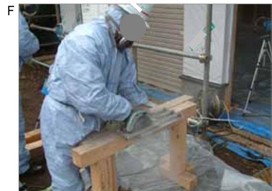
屋根工が、石綿含有の波型スレートを切断する作業です。屋根材、壁材、床材等、建築現場には石綿含有製品が多く、このように現場で切断作業を行うことにより、現場で粉じんが発生します。