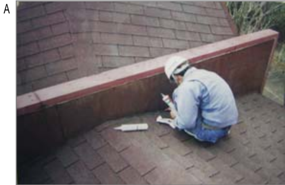
A 石綿含有の屋根材と立上り部(パラペット部)との継ぎ目(雨漏り)をシーリング補修しているところ。少し傷口を広げ(切り欠き、サンダー)補修しますが、その際、石綿が飛散する可能性があります。