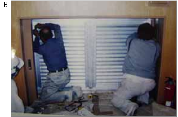
B サッシ工事(金属建具工事)。写真では判りづらいのですが内壁などに吹つけられている石綿を少し掻きとって鉄骨面から補強のリブ(力骨)などを入れる箇所があります。