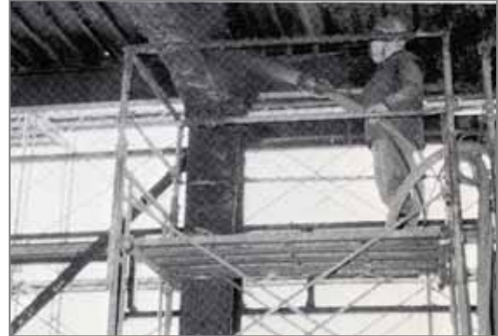
B 鉄骨建て方・床・屋根が出来ると耐火工事が始まります。吹きつけ機を用いて石綿の吹きつけをおこなっていました。