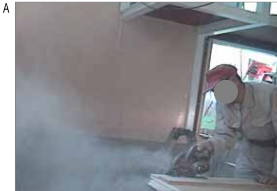
日本家屋の新築(街場 まちば)作業で、大工職が石綿非含有の石膏ボードを丸鋸(のこ)で切断しています。石綿含有の場合にも、同様に多量の粉じんが飛散したことが想像されます。