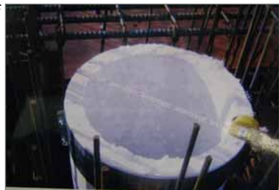
F 煙突ライニング材。写真はノンアス品。従前は茶石綿の高含有品を使用。多くのビルで採用していました。煙突内の上昇気流(ドラフト)で若干、繊維が大気に放出され作業員がばく露する可能性があります。