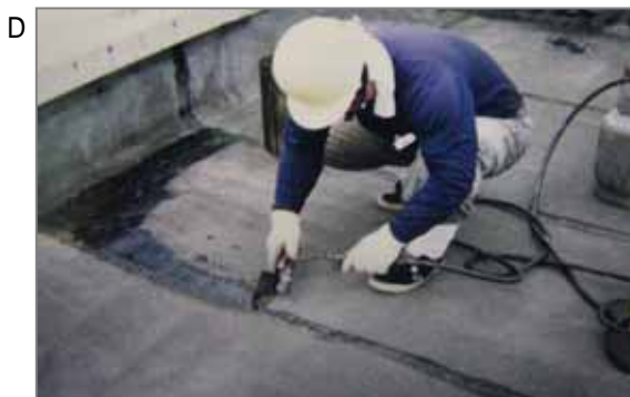
屋上での修理作業、屋根材に石綿が含有していることもあり、漏水箇所を切り開いて修理する際に石綿が飛散することがあります。写真はアスファルトフェルトの補修作業(一部、石綿含有品あり)。

このような構造となっていることを知らずに、壁の修理、補修をしたり、解体をすれば、作業者がばく露する可能性があります。