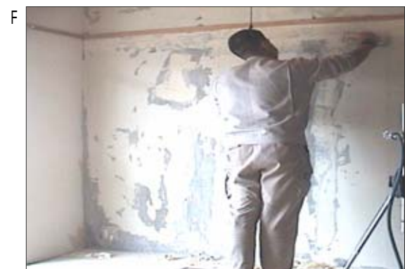
F 表具工がクロスを剥がした後で、釘穴にパテを詰めこすところ。写真のように石膏ボードの場合は石綿飛散はありませんが、石綿含有ボードの場合は飛散もあります。