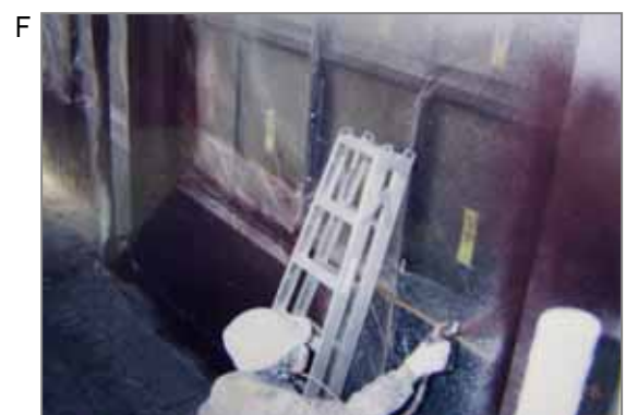
F 塗装(ガン吹き)工事。塗料には顔料、沈降防止剤、増量剤、流動性増進剤などの目的で白石綿混入のタルクがはいっていました。