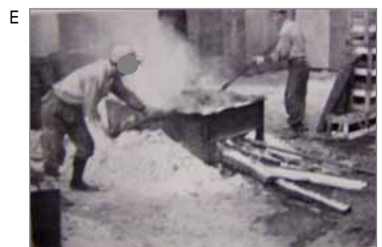
昭和30年代のアスファルト工事(昭和60年頃まで)。アスファルト(石炭副産物・コールタール)の塊をフネ(鉄板の桶)に入れ、下から溶けるまで熱します。アスファルトに石綿を混ぜた時期があったようです。からの順で作業が行われます。