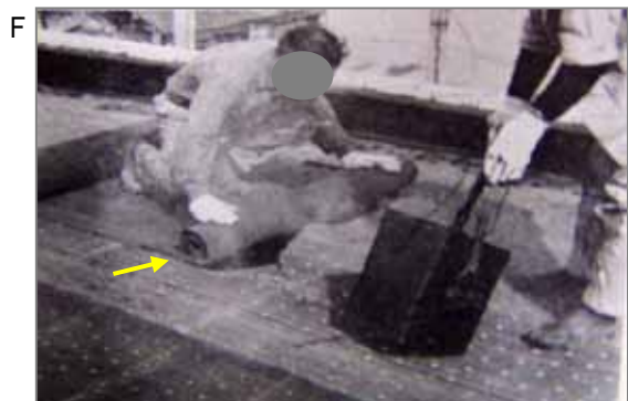
昭和30年代の屋根の防水工事。アスファルトフェルト(卷材)を押し広げ、重なり部分に解かしたアスファルト(増粘剤として石綿を混ぜることあり)を流し込みます。非常に「熱い作業」なので石綿製の手袋等を使用することもありました。