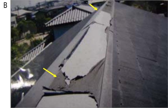
B 屋根の最上部(棟)の塗装が経年劣化で剥れてきた写真です。屋根材は彩色石綿スレート瓦。補修、取替え作業に伴い、屋根工がばく露する可能性があります。