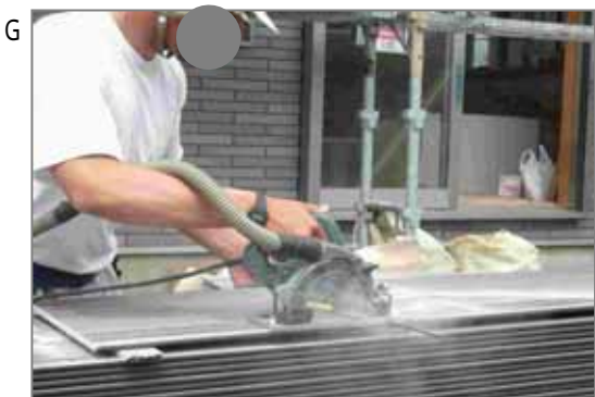
住宅の外壁サイディング張り工事。大工、屋根工、板金工なども施工します。屋外での現場合わせの切断ですから風向きによっては粉じんが遠くまで飛びます。粉じん発生量は非常に多いです。