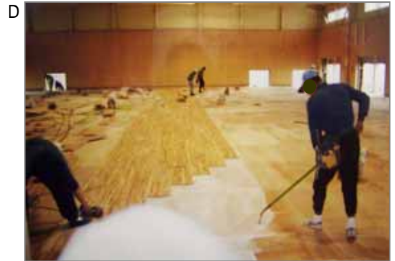
D 体育館などの木質フローリング張り。下地は鋼製二重床。石綿セメント板など2層から3層貼られています。これにフェノール樹脂配合の接着剤などで仕上げの床を貼ります。修理、解体時にばく露の可能性があります。