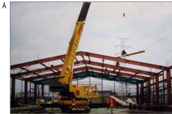
A 鉄骨で建物の骨格を作ります(鉄骨工事・とび職)。建物の仕様・要求によりこの柱や梁に後から耐火被覆(石綿の吹きつけ)を施工します。