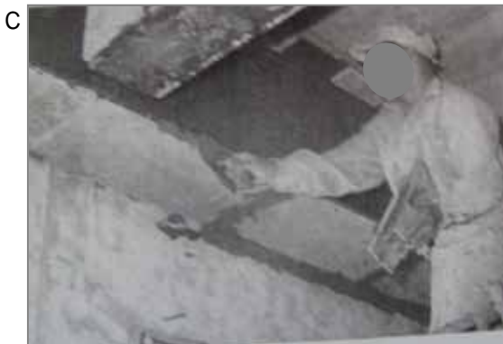
C 吹きつけとは別の工法で茶石綿で出来た石綿耐火被覆板の張り工事。クギ、カスガイおよび石綿含有耐熱接着剤で留めます。昭和45年前後の工法で、吹き付けに比べればばく露量は少ないですが、現場で切断加工する際には粉じんが発生しました。