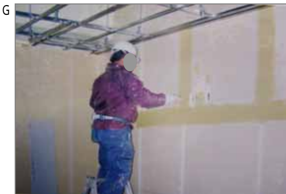
G クロス工。下地の石膏ボード(石綿含有時期あり)の継ぎ目にパテごきします。パテ(石綿含有は未確認)は乾燥により痩せるので何度も丁寧にかかけます。