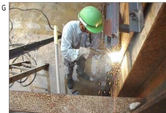
G 鉄骨工によるスポット溶接作業です。鉄骨工は溶接、建材の切断、保温材の巻き付けなど、様々な作業を行った場合があり、石綿に接する機会は多かった人もいました。