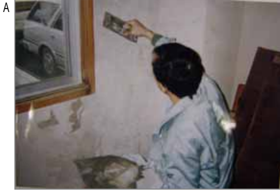
A 左官工事の壁下地調整。この後に塗装したり壁紙を貼ったりの作業があります。これらの下地用接着剤等に不純物としての石綿が入っていた可能性があります。