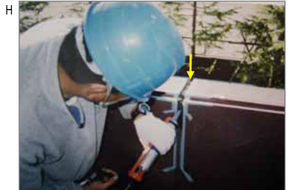
H シーリング(コーキング)作業。継ぎ目や隙間、クラック部などに充填します。以前のコーキング材にはかなりの含有率で石綿が入っていました。劣化するとボロボロになるものもあります。