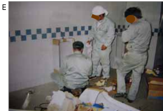
E トイレ取付けなどを給排水設備工事(衛生工事)といいます。石綿セメント板や石綿化粧タイル板の壁に穴を開けたり、カットしたりするため、石綿ばく露が皆無とは言いきれません。