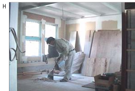
H 現場監督が、朝一番でホウキ清掃をしている所です。前日に堆積した各種の粉じんが、再飛散し、高濃度で吸入する可能性があります。