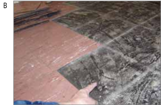
床の石綿含有ビニル床タイルは重歩行度や温湿度、経年などで劣化(剥れ、浮き、磨耗など)します。この黒い接着剤にも石綿は混入しています。張替えはこの接着剤をキレイにサンダー掛しますが、その際に石綿にばく露する可能性があります。