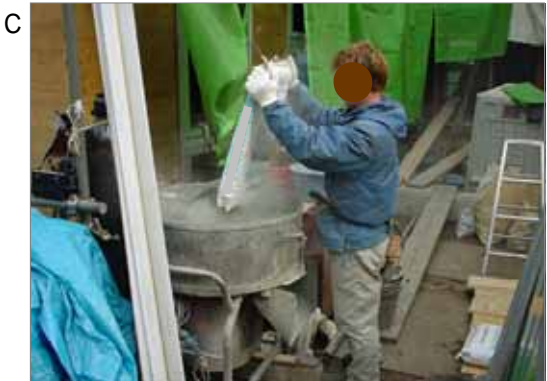
民家の新築作業で、左官工がセメントにモルタルを投入している作業で、投入時に粉じんが発生します。モルタルには、石綿含有製品もありました。