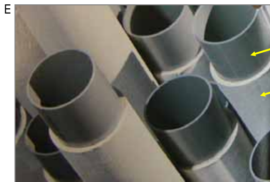
E 建物内の給排水用パイプ、石綿セメントビニル管。室内との温度差によるパイプ表面の結露防止対策として、内側は流水しやすい塩ビ管にして外皮に石綿管を断熱材としていました。破損や修理時にばく露の可能性があります。