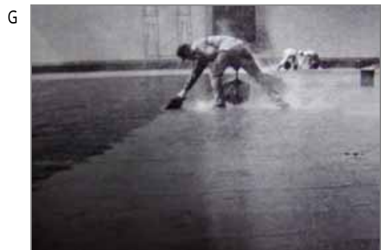
最後のタールを上塗りしているところ。打ち粉として微少な石綿をふっていたかもしれませんが確認できていません。このあとの時代は、石綿とは関連のないシート防水が主流になりました。