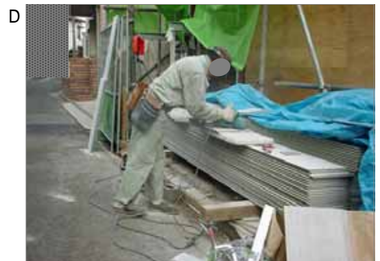
新築時の外壁の石綿含有サイディングを切断する作業です。1970年代は大工職がサイディングの切断をする事も多かったようです。