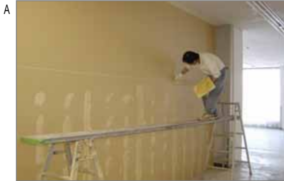
リフォームの主は壁紙の張替え(クロス工)。下地調整が最重要でパテ(目止め)で何回もしごきます。昔はこのパテに石綿混和材が、またごく一部ですが壁紙にも混入されていました。