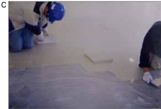
C タイル工(Pタイルは商品名で一般名称はビニールアスベストタイル、縮めてビニアスタイルと呼ぶ)。昭和の時代は全て白石綿が高含有。このタイル張りの接着剤にも石綿が含有されており、修理、解体時にばく露の可能性があります。