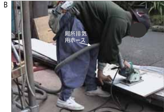
日本家屋の新築で、外壁の石綿含有サイディングを、サイディング工が丸鋸で切断しています。最近の作業で局所排気のホースが見られます。