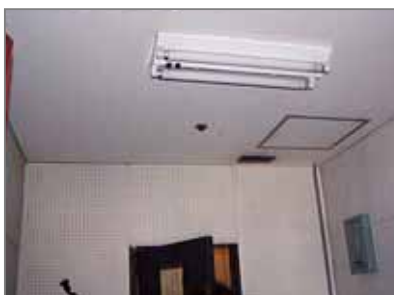
天井/石綿含有吸音板、 壁/石綿含有けい酸カルシウム有穴板