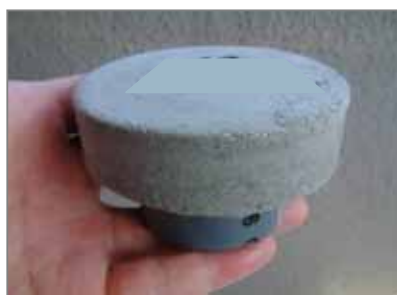
石綿ビニール管 (マンション等耐火部の配管に使用)