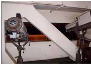
耐火ボード (競技場、劇場などのスポットライト室)