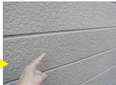
サイディング 拡大像