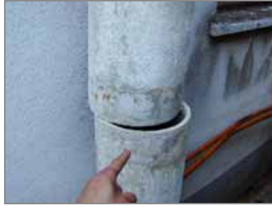
雨水樋使用石綿パイプ