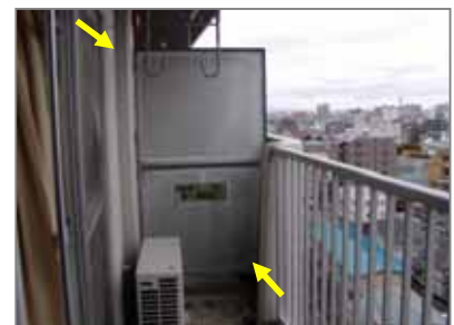
フレキシブル板 (マンション等のベランダで「非常時の場合はこの壁を破って…」と書いてある板)