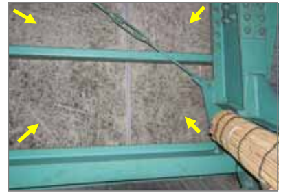
木毛・木片セメント板