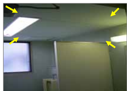
フレキシブル板 トイレの天井