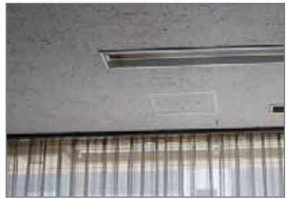
岩綿吸音板 (一般的な建物の天井に使用)