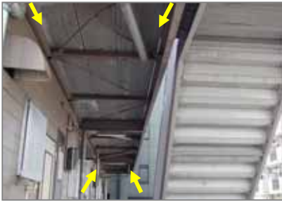
中空 押し出し成形板 (床の耐力板)