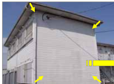
一般住宅外壁材(サイディング)