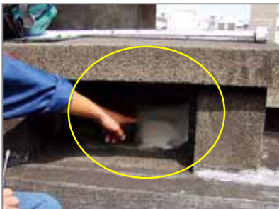
学校屋上の石綿パイプ(煙突用)