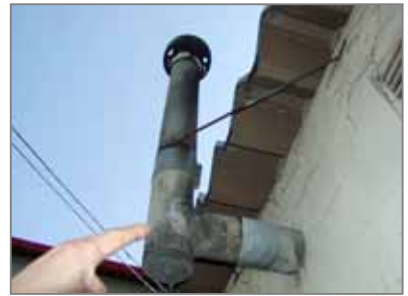
暖房排熱用石綿パイプ