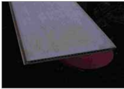
中空 押し出し成形板 (中空部が見える)