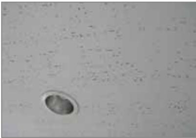
岩綿吸音板 (一般的な建物の天井に使用)