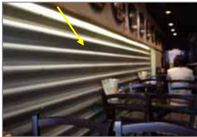
波型スレート (デザイン感覚で壁に貼ったレストラン)