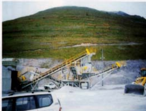
「鉱業及び採石業快適職場推進委員会」（平成12年度）において石灰石鉱山、砕石業300事業場を実施したアンケート調査結果より